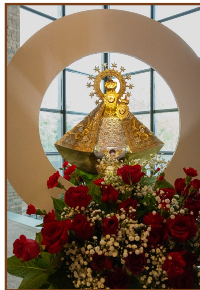
Nuestra Señora de Peñafrancia, una popular devoción mariana filipina.

padre Peyton en su labor por llevar la paz a las familias y a la nación de Filipinas, mientras rendíamos homenaje a Nuestra Señora de Peñafrancia, reconocida por su guía maternal, su poder sanador y su protección en los momentos difíciles de nuestra vida.