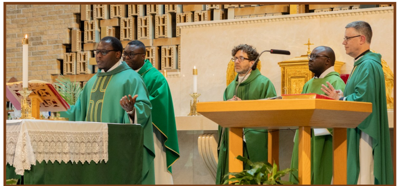
Celebración de la misa en la parroquia de Santa Teresa del Niño Jesús, South Bend, Indiana, USA, 6 de septiembre de 2025.